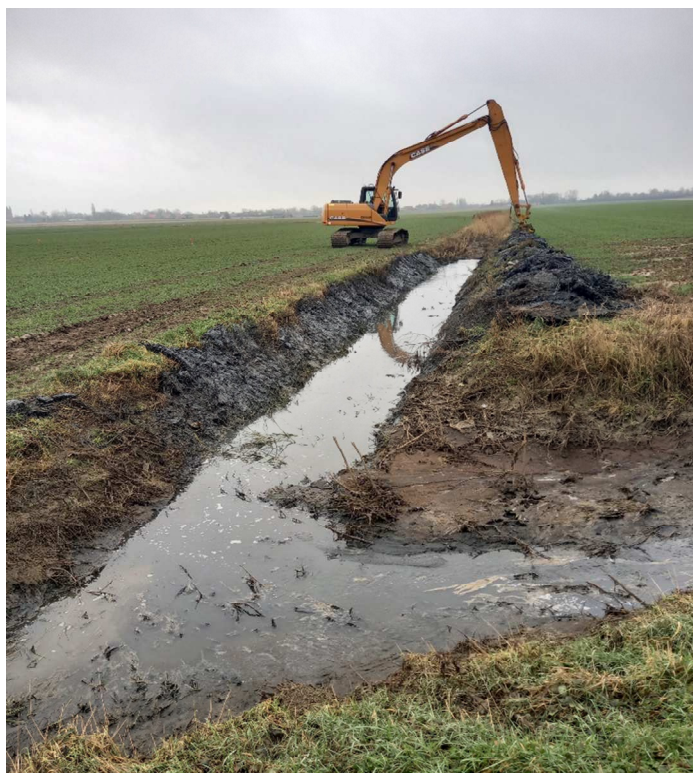
Curage du fossé déclenché sur la demande de la mairie, et la pollution existante !!