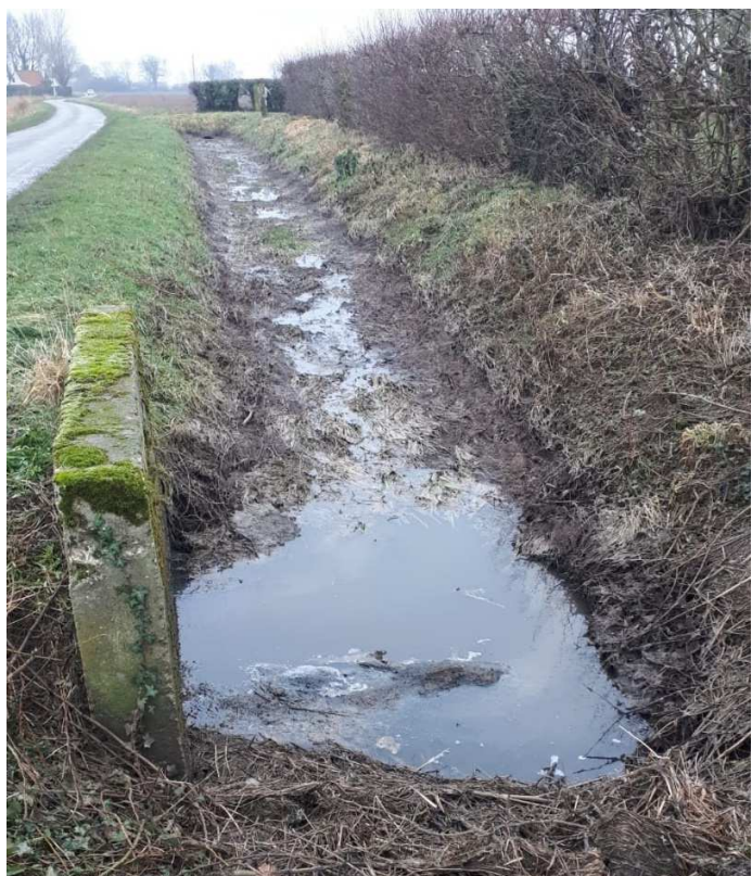
Fossé chargé de digestat.